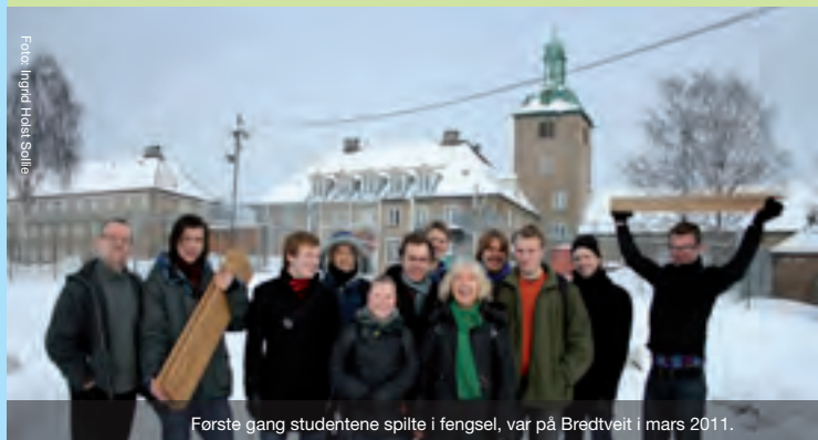
Første gang studentene spilte i fengsel, var på Bredtveit i mars 2011.

Musikkhøgskolen tar ansvar for å formidle og bringe musikk ut til grupper som ikke har så enkel tilgang til levende musikk og våre konsertsaler. Som et ledd i det pedagogiske opplegget reiser derfor studentene ut og holder konserter for ulike publikumsgrupper.